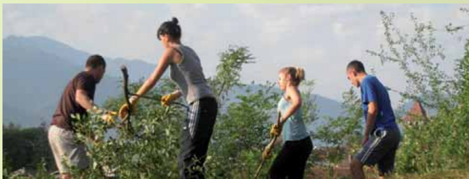
Débroussaillage des coteaux par les services et les jobs d'été en prévention des incendies.