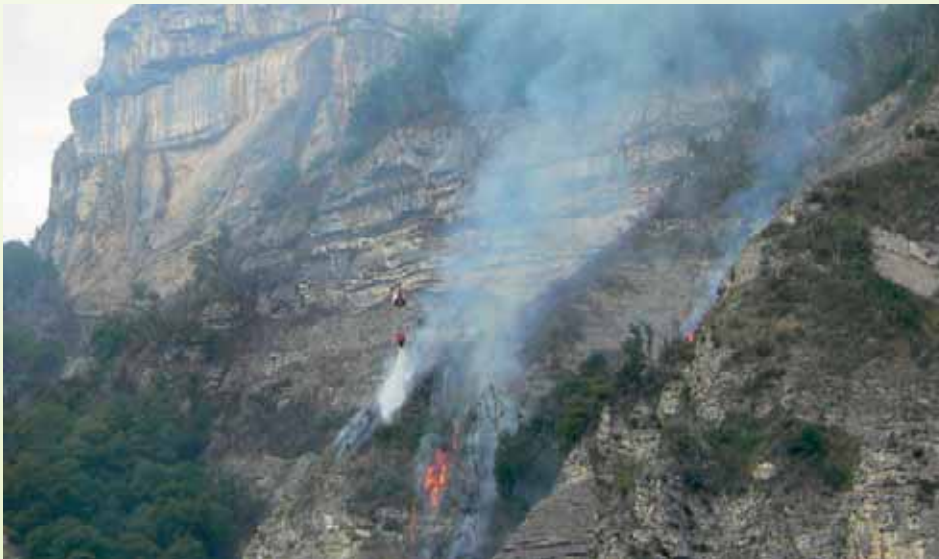
Intervention d'un hélicoptère pour lutter contre l'incendie d'août 2009.

Les incendies qui ont eu lieu au cours des étés 2009 et 2003 ont rappelé l'existence d'un risque de feu de forêts à Crolles, notamment lors de conditions climatiques particulières (sécheresse, et vent en 2003). Localisés sur les cotteaux, ces feux n'ont pas engendré de dégât.